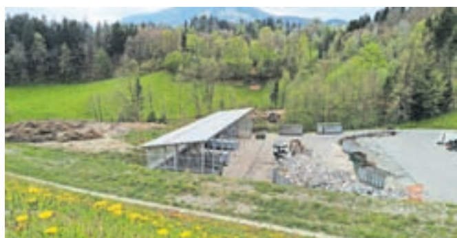
Nova nadstrešnica na spodnjem platoju za prekladanje odpadkov

oblaščne družbe, saj se zaradi zunanega vpliva spreminjata tudi sama teža in energijska vrednost odpadkov. Investicijo je financirala Občina Tržič. V prihodnje je predvidena izgradnja še ene nadstrešnice nad osrednjim delom prekladalnega platoja ter postavitve strehe nad celotnim zbirnim centrom odpadkov.