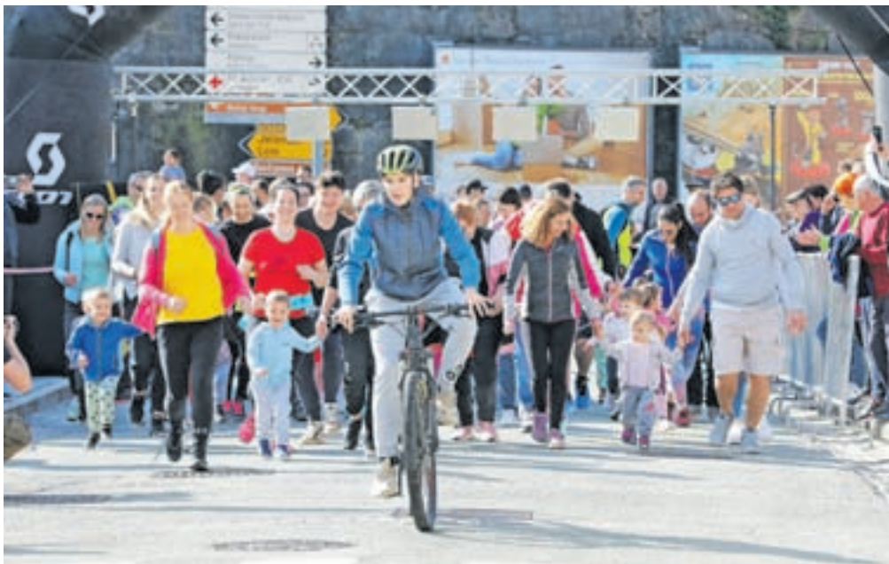
Tek so začeli s skupino otrok, ki so skupaj z vzgojiteljicami iz vrtcev in starši premagali tristo metrov.