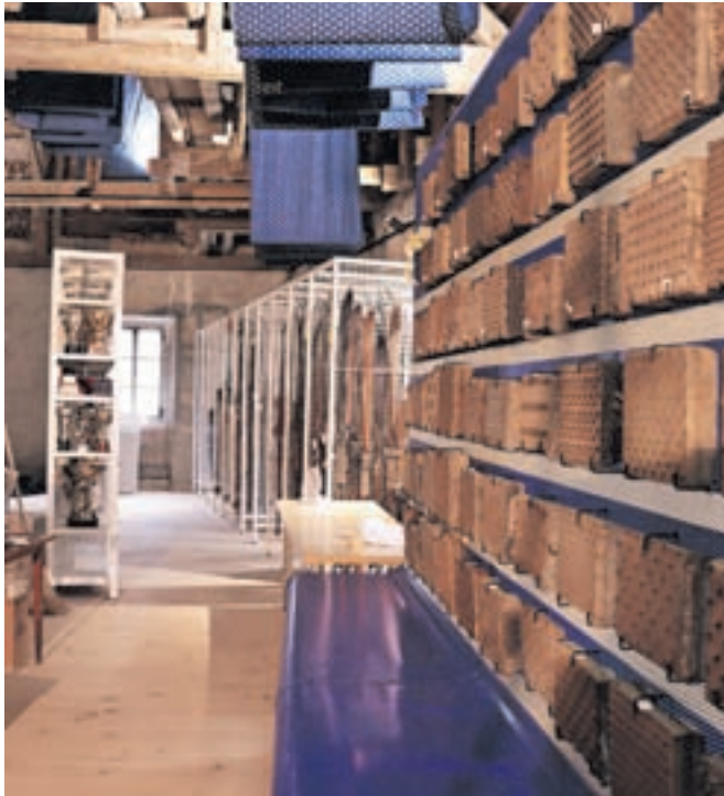
Urejanje podstrehe muzeja / FOTO: ANDREJA RAUCH

Ogledni depo na podstrehi ne bo le skladišče, temveč želimo ustvariti ambient »babičine podstrehe«, omogočiti sprehod po labirintu med množico predmetov, ki bodo obiskovalce navduševali s svojo sporočilnostjo, estetiko, nenavadnostjo in izjemnostjo.