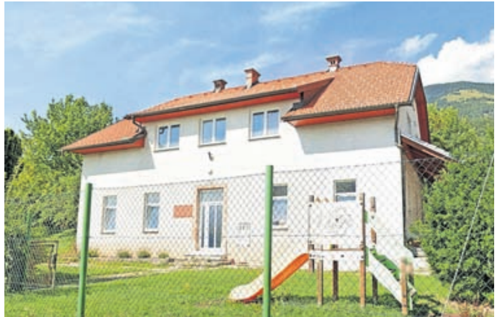
Iščejo uporabnike in investitorje za prostore stare šole.