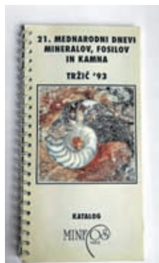
Katalog MINFOS-a Trzič 1993

ževalne in turistične name-ne. Bil sem njen prvi »začasni« direktor. Večinski družbenik te izvajalske organizacije je bilo prav naše društvo z 39,70-odstotnim