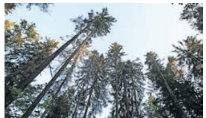
Iz podatkov popisa izhajajo glavni podatki o gozdnih fondih – lesna zaloga in prirastek.

Tržič – Kot je pojasnil vodja tržiške krajevne enote Zavoda za gozdove Slovenije Aljaž Černe, bodo letos izvajali dve vrsti meritev: opise sestojev in izmero drevja na stalnih vzorčnih ploskvah (SVP). »Pri opisih sestojev se na terenu popiše stanje gozdov, gozdovi s podobnimi lastnostmi pa se združijo v sestoje. Vsakemu sestoku se izmeri lesna zaloga, popišejo se drevesne vrste in drugi parametri ter določijo potrebne ukrepe v naslednjem desetletnem obdobju. Izmera drevja na SVP pa poteka tako, da se na stalnih vzorčnih ploskvah v izmeri 2 in 5 arov periodično na vsakih 10 let izmerijo določeni parametri dreves, kot so drevesna vrsta, premer, višina, socialni položaj, kakovost, mrtva biomasa, posek. Iz podatkov popisa SVP izhajajo glavni podatki o gozdnih fondih – lesna zaloga in prirastek.«