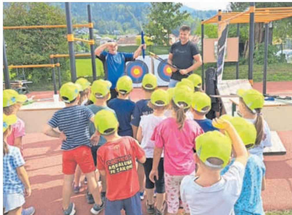
Veliki poudarek so dali športu mladih.