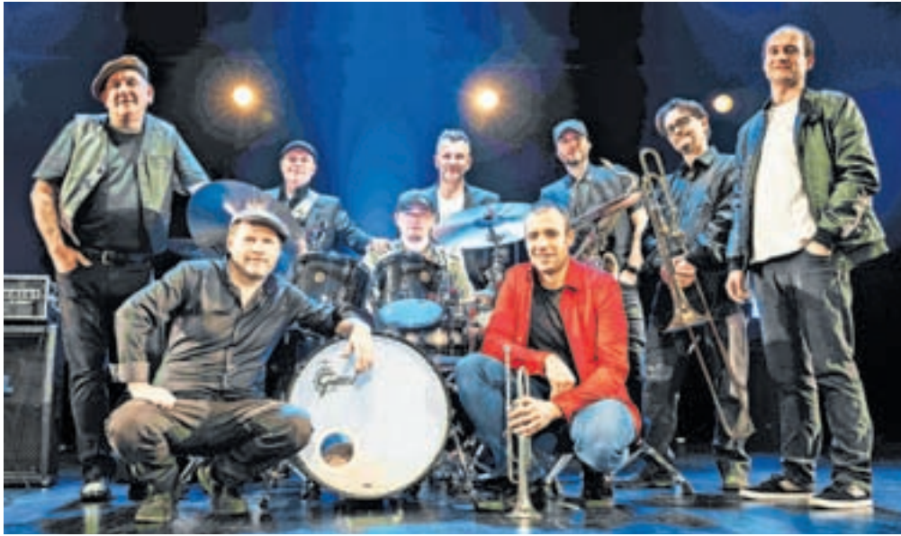
Orlek express iz Zasavja prihaja ob Tržiško Bistrico

Če na hitro preletim vašo koncertno dejavnost v zadnjega četrta stoletja, je minilo že kar nekaj časa od vašega zadnjega nastopa v Tržiču ... V Tržiču smo nazadnje nastopili poleti 2019, ko smo igrali na tržiški »plaži«. V goste so nas v sodelovanju z Občino Tržič povabili tržiški »pleharji«, s katerimi smo tudi skupaj zaigrali nekaj pesmi. Še iz časa, ko smo Orleki pogosto nastopali skupaj s Pihalnim orkestrom Svea Zagorje, nam je ostalo sedem aranžmajev in vsako leto nas eden ali dva pihalna orkestra povabita k sodelovanju.