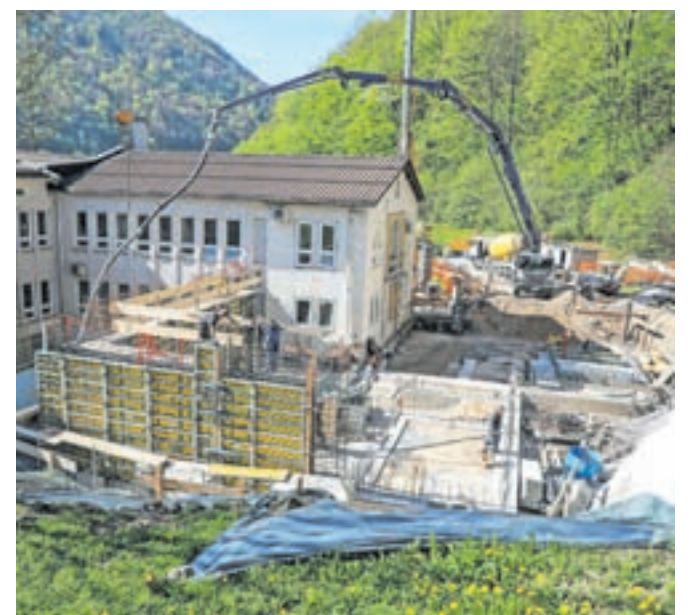
Če bo šlo vse po načrtih, bodo čez slabo leto dni prerezali slavnostni trak ob odprtju novega prizidka.