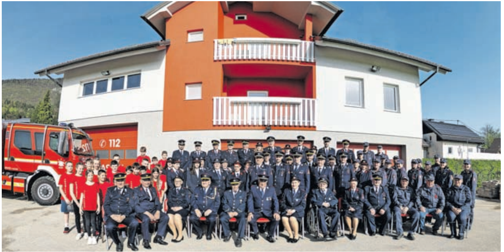
Kriški gasilci zbrani v jubilejnem letu

Tudi letos pripravljamo prvomajsko kresovanje na Polani nad Križami, in sicer 30. aprila. Glavno praznovanje 100-letnice društva bo 8. junija, ko bo skozi vas Križe potekala velika gasilska parada, za zaključek pa se bomo povесelili z ansambлом Modrijani.